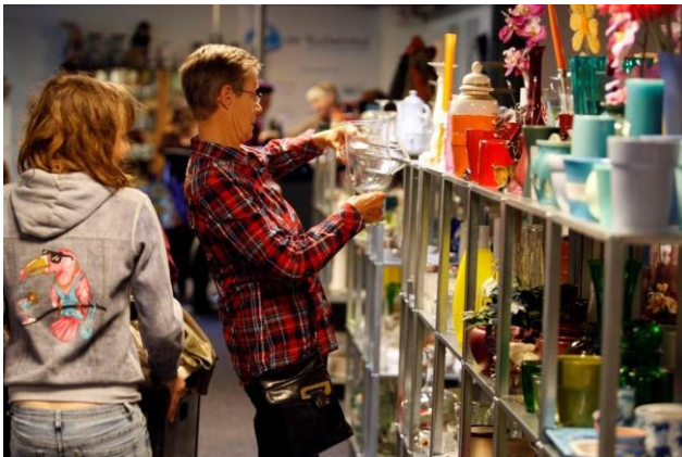
Bezoekers bekijken artikelen in De Ruilwinkel

Op 1 mei worden alle vrijwilligers ingelicht over de stand van zaken met betrekking tot de dienstenruil en wordt uitgelegd hoe we willen gaan werken. Met de op en aanmerkingen van de