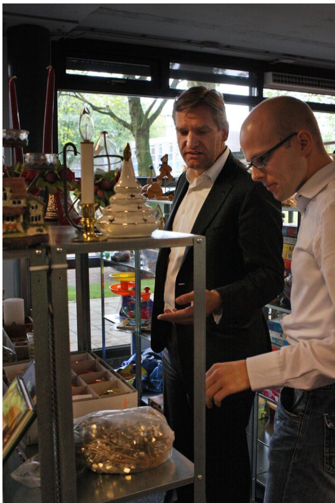
Sybrand van Haersma Buma op werkbezoek in De Ruilwinkel

Naast deze bezoeken en persoonlijke contacten is er ook geregeld telefonisch contact geweest met de fondsen en instellingen die De Ruilwinkel ondersteunen.