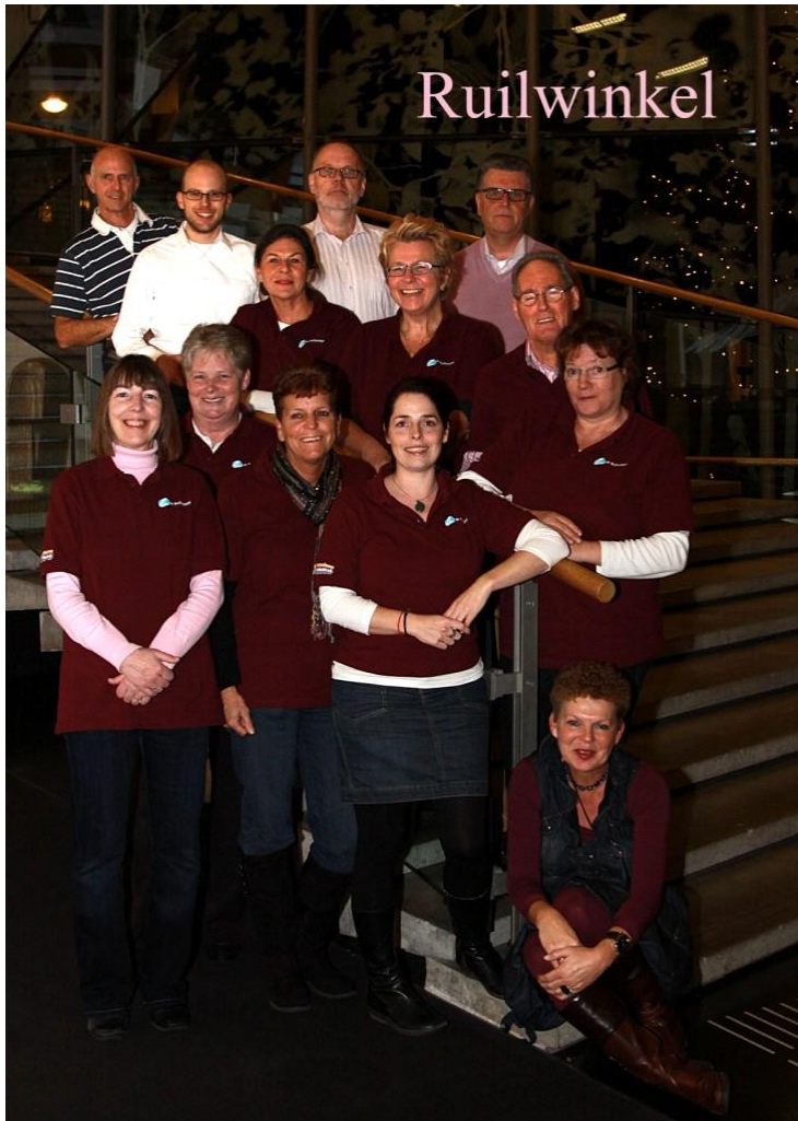
De Ruilwinkel genomineerd voor de vrijwilligersprijs 2011

De eerste week van januari begint al goed. De Ruilwinkel is genomineerd voor de vrijwilligersprijs