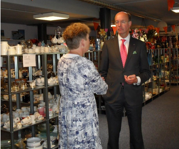
Burgemeester Eenhoorn bezoekt De Ruilwinkel

Dit jaar heeft vooral de nadruk gelegen op het opbouwen van contacten met de gemeente. De Burgemeester en vrijwel alle wethouders hebben dit jaar De Ruilwinkel bezocht. Als vervolg zijn er ook contacten gelegd met de hoogste ambtenaren in de gemeente die zich in het bijzonder bezighouden met re-integratie. Alle contacten zijn gelegd en onderhouden door de coördinator.